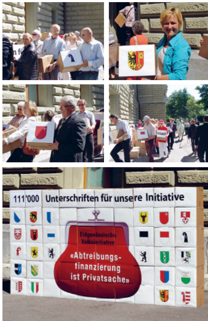
Impressions lors du dépôt des signatures à Berne le 4 juillet 2011

Pour être acceptée, une initiative a besoin de la double majorité des voix et des cantons. La majorité des votants et la majorité des cantons doivent donc se prononcer en faveur de l'initiative. C'est le but que nous poursuivons avec « Financer l'avortement est une affaire privée » !